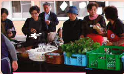
地元農家様による 野菜販売