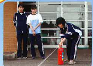
新任職員による消火器 訓練です。