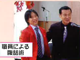
職員による 腹話術