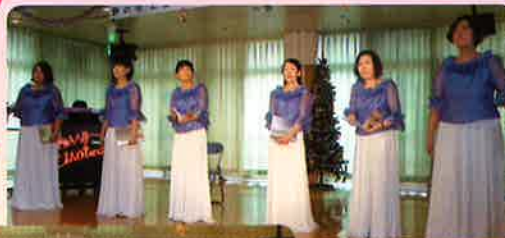
野の花エコーの皆様 高岡ライオンズクラブの皆様

美しい歌声に利用者の皆さん聞き惚れていました。 シクラメンの鉢植えも頂きました。 ありがとうございました。