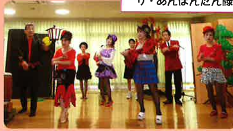
ザ・あんほんたん様