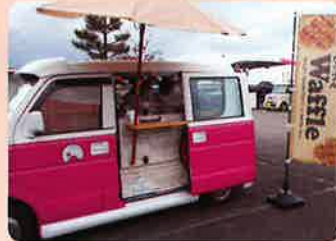
CAFE LA CREBON (カフェ・ラ・クレボン) の甘くて美味しいワッ フルに、みんな大満 足でした。