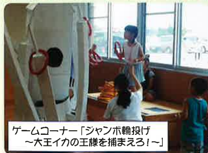
ゲームコーナー「ジャンボ輪投げ 〜大王イカの王様を捕まえろ!〜」