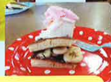
バナナあんこどら焼き アイス添え