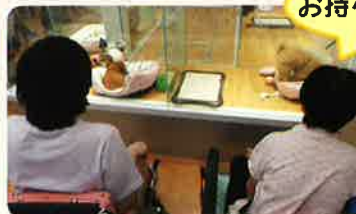
お持ち帰りしたい...