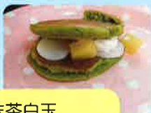
抹茶白玉 フルーツどら焼き