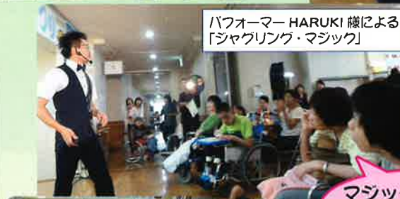
マジックとトークに くぎづけです