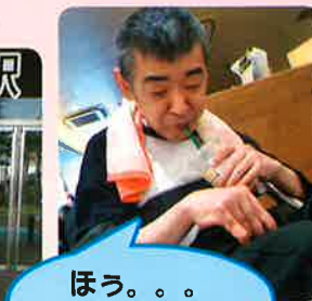
ほう。。。 これがスタバか

3年度計画で スタートしました! 利用者の方が、いくつかのコース から選んだ場所へ外出です♡