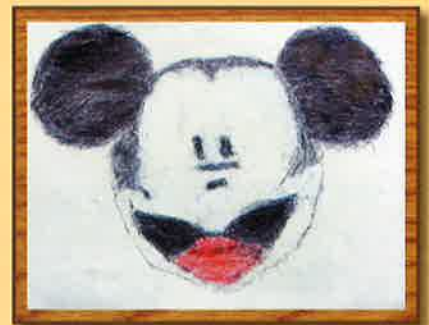
作：山本 達也 「ミッキーマウス」