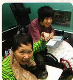
砺波イオンコース

3年度計画で スタートしました! 利用者の方が、いくつかのコース から選んだ場所へ外出です♡