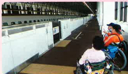
新高岡駅 北陸新幹線コース