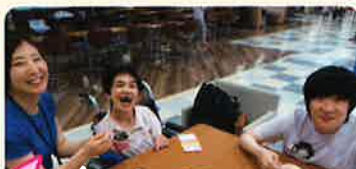
アイスも食べてHAPPYです☆