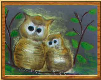
作：田中 健二 「よりそって」