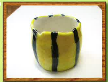
作：堀川 義人 「湯呑み」