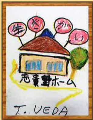
作：上田 敏彦 「生きがい」