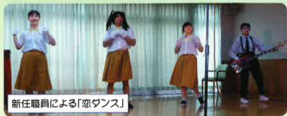
新任職員による「恋ダンス」