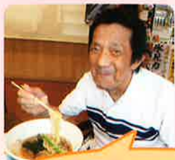
らーめん、オムライス! どちらもうんまいね〜