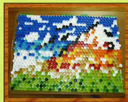
ペットボトル キャップアート

「畑に入って野菜を 食べるピーターラビットと ヨーロッパコマドリ」 作：共同作品