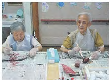
「本物みたいな色になったねー」

まだまだ暑いですが、涼しい秋が来るのを心待ちにしてさつま芋畑を作っています。新聞をひねったり、色を塗ったり、ハサミで切ったりと、みなさん出来る作業を行なっています。