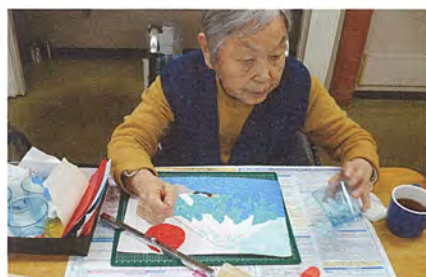
「富士山にはやっぱり日の出ね～」