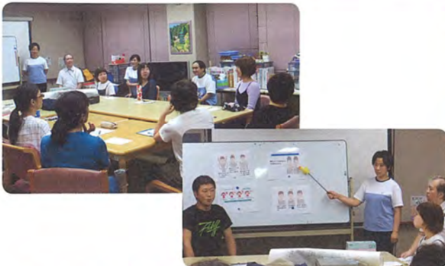
所内研修(口腔ケア研修)