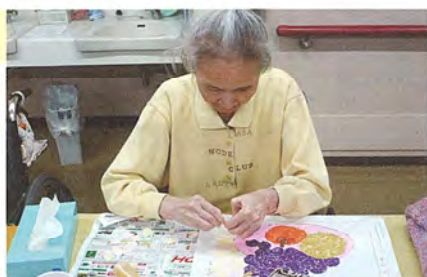
「美味しそうに見えるかしら…」