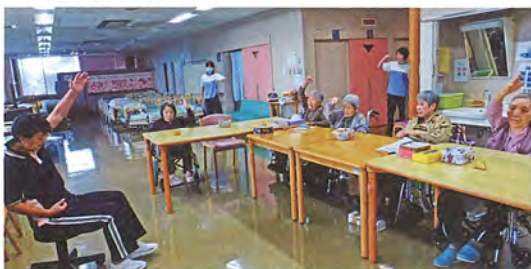
元気よく、「イチ、二、サーン！」