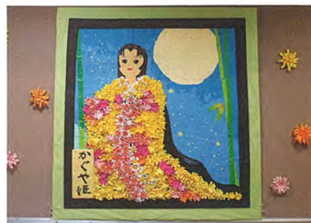
「どう？私綺麗でしょう？」

菊人形 - かぐや姫 利用者の皆さんに作っていただいた菊を身にまとい、おすましをしているかぐや姫です。立札も書道の得意な利用者さんに書いていただきました。