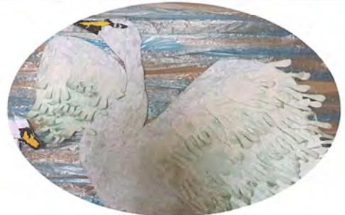
白鳥の羽は、たくさんの手形です!