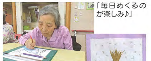
「毎日めくるのが楽しみ!」