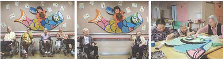
「大変だけど、みんなですれば早いね～」